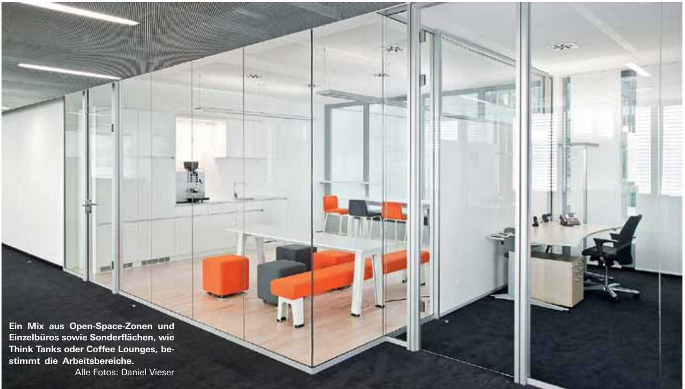
Ein Mix aus Open-Space-Zonen und Einzelbüros sowie Sonderflächen, wie Think Tanks oder Coffee Lounges, bestimmt die Arbeitsbereiche.