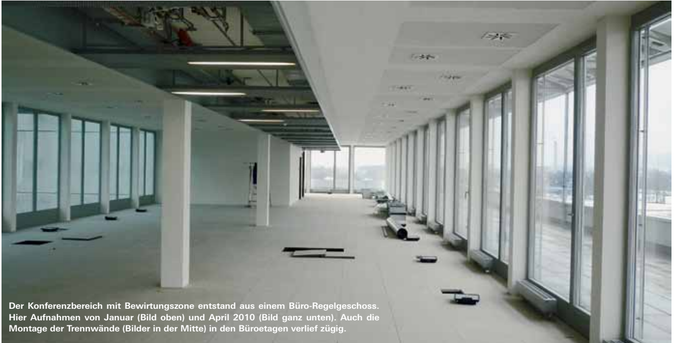
Der Konferenzbereich mit Bewirtungszone entstand aus einem Büro-Regelgeschoss. Hier Aufnahmen von Januar (Bild oben) und April 2010 (Bild ganz unten). Auch die Montage der Trennwände (Bilder in der Mitte) in den Büroetagen verlief zügig.